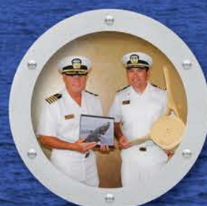
2人のキャプテンが乗船