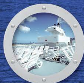
高さ18.2mの展望サンデッキ