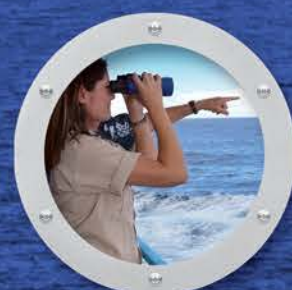
海が大好きなナチュラリスト