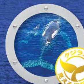
クジラが見える保証付き