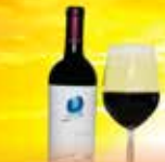
오퍼스 원 빈티지 병당 375달러