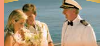
둘만의 새로운 서약 커플당 190달러