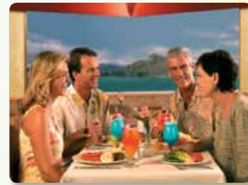
스타 시그너처 마이 타이 한잔