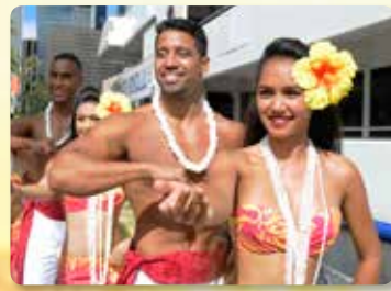
아름다운 댄서들의 승선전 홀라 환영인사