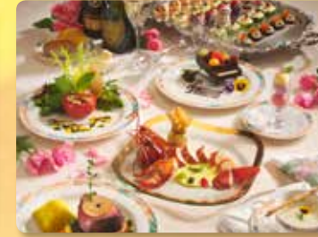
계절별 선보이는 7코스 저녁식사 살아있는 메인산 랍스터와 최상급 소고기 안심스테이크