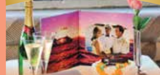
리셉션 플랜 개인당 50달러