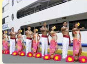
승선전 홀라 환영인사 & 승선시 본보야지 홀라댄스