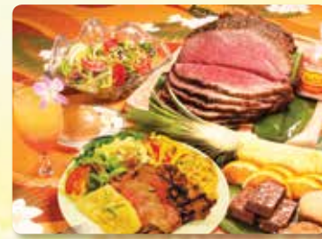
로스트 비프 뷔페 저녁식사와 스타 시그너처 마이 타이 한잔