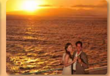
숨막힐 듯 아름다운 노을 풍경 잊지 못할 추억을 만들어보세요