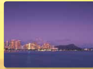
각층에 있는 전망갑판에서 볼수 있는 다이아몬드헤드까지 펼쳐지는 와이키키의 스카이라인