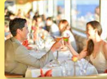
프라이빗 테이블 3잔의 슈퍼 프리미엄 음료