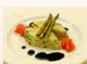
발사믹소스를 곁들인 쥬키니 나폴레옹