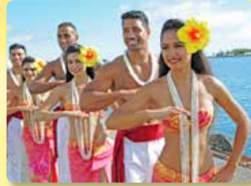
승선전 홀라 환영인사