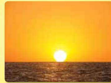
18미터 높이의 전망갑판에서 보는 360도의 파노라마한 전경