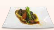
블랙 트러플 두부와 당근 오소부코 으깬 고구마