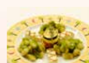
구운 두부와 베지터를 나폴레옹 페스토 뇨끼