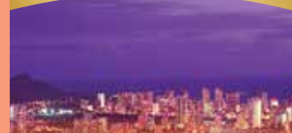
와이키키 교통이 포함된 야경투어 개인당 36달러