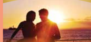
개인 사진작가 540달러