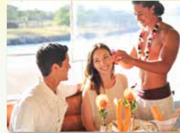
삼페인 토스트와 두잔의 프리미엄 음료