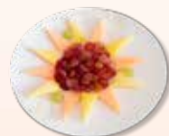
신선한 과일 메들리