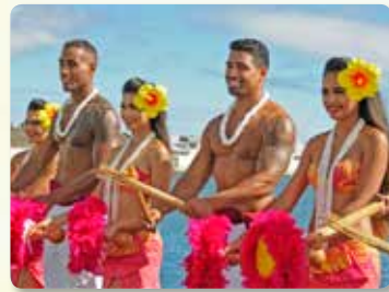
승선전 홀라 환영인사 & 승선시 본보야지 홀라댄스