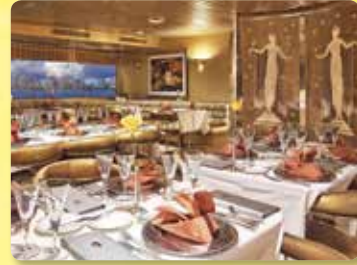
슈퍼 노바 룸 새로운 본보야지 홀라댄스