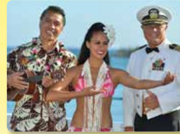
선장의 환영 리셉션 하와이안 벨리니 칵테일 제공