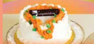
레이 케이크 40달러부터