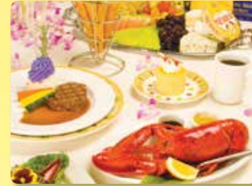
5코스 저녁식사 메인산 랍스터와 소고기 안심스테이크