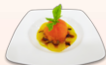
발사믹 소스를 곁들인 콩카세 카무엘라 토마토 콩피와 골든 비트