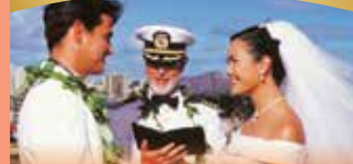
선장주례 웨딩 커플당 750달러