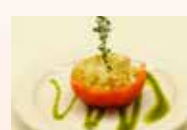
카무엘라 토마토와 쌀밥 필라프