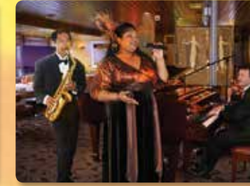
오하우 탑 아티스트 트리오의 라이브 재즈 공연