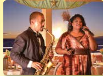
저녁식사동안 라이브 재즈