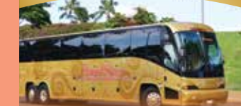
와이키키에서 개인당 15달러 코올리나에서 개인당 34달러