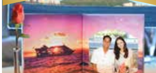
셀레브레이션 플랜 개인당 30달러